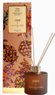
Difusor de Perfume Terra do Sol - 200ml Ref.: 104059200