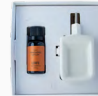
Kit Aromatizador Eléctrico + Óleo Concentrado Mandarina Ceylon - 20ml Ref.: 14090220