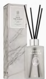
Difusor de Perfume Into the Night - 250ml Ref.: 105003201