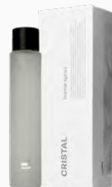
Home Spray Cristal MASP - 100ml Ref.: 10330100