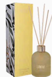
Difusor de Perfume Vanilla Bloom - 200ml Ref.: 105044200