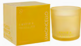
Vela Perfumada Limoncello - 170g Ref.: 104039170

Saída: Limão Siciliano, Lima, Frozen de Menta Corpo: Accord Gelato, Flor de Lótus Fundo: Baunilha, Caramelo