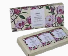
Kit Sabonete em Barra Magnólia Pacífica - 3 x 80g Ref.: 102026380