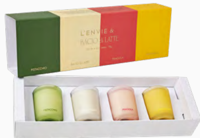
Kit de 4 Mini Velas Bacio di Latte - 4x70g Ref.: 10408470