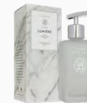
Sabonete Líquido Lumière - 250ml Ref.: 102002250