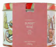
Vela Perfumada em Lata Sunset Rosé - 250g Ref.: 10608250