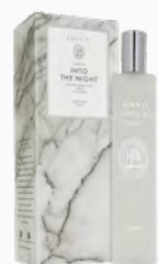
Home Spray Into the Night - 100ml Ref.: 104003101