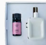
Kit Aromatizador Eléctrico + Óleo Concentrado Sunset Rosé - 20ml Ref.: 14098020