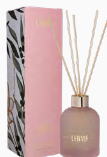
Difusor de Perfume Lotus Garden - 200ml Ref.: 105040200