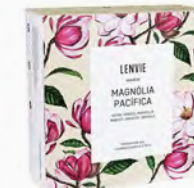
Kit Aromatizador Eléctrico + Barra de Cera Perfumada Magnólia Pacífica - 40g Ref.: 10137474