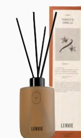
Difusor de Perfume Tabaco & Vanilla - 220ml Ref.: 10205220