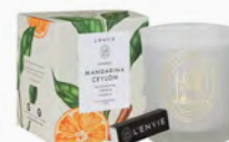
Vela Perfumada Mandarina Ceylon - 210g Ref.: 104074170