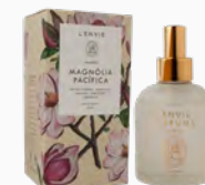
Home Spray Magnólia Pacífica - 200ml Ref.: 104013230