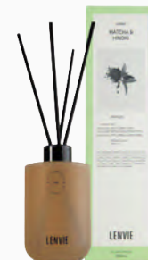
Difusor de Perfume Matcha & Hinoki - 220ml Ref.: 105016220