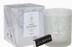
Vela Perfumada Into the Night - 210g Ref.: 101003200