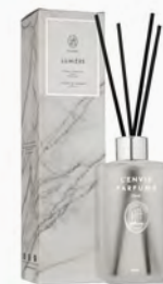
Difusor de Perfume Lumière - 250ml Ref.: 105002201