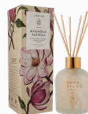
Difusor de Perfume Magnólia Pacífica - 200ml Ref.: 105013250