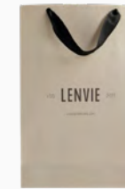
Sacola Tamanho M Ref.: 446056