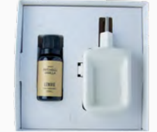
Kit Aromatizador Eléctrico + Óleo Concentrado Patchouli Vanilla - 20ml Ref.: 14093320