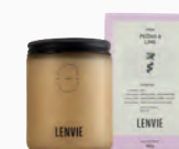
Vela Perfumada Peônia & Lima - 190g Ref.: 102043190