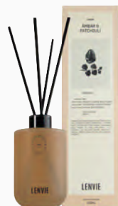
Difusor de Perfume Âmbar & Patchouli - 220ml Ref.: 105024220