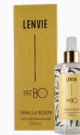
Água Perfumada Splash Vanilla Bloom - 250ml Ref.: 106028250