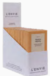
Barra de Cera Perfumada Pêssego Oriental - cx. com 10 x 40g Ref.: 14108340