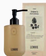
Sabonete Líquido Âmbar & Patchouli - 220ml Ref.: 103024220