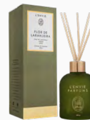
Difusor de Perfume Flor de Laranjeira - 200ml Ref.: 105079200