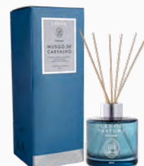
Difusor de Perfume Musgo de Carvalho - 200ml Ref.: 104088200

Fundo: Acorde Amadeirado, Musgo de Carvalho