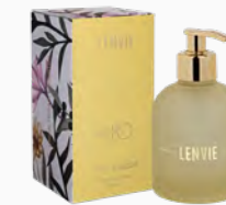
Sabonete Líquido Vanilla Bloom - 200ml Ref.: 102044200