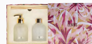
Kit Box Luxo Magnólia Pacífica Ref.: 90100001