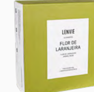
Kit Aromatizador Eléctrico + Barra de Cera Perfumada Flor de Laranjeira - 40g Ref.: 10134074