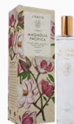
Home Spray Magnólia Pacífica - 100ml Ref.: 104013100