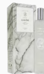
Home Spray Lumière - 100ml Ref.: 104002100