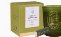
Vela Perfumada Flor de Laranjeira - 210g Ref.: 10401003