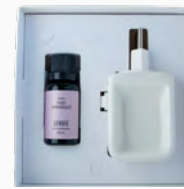
Kit Aromatizador Eléctrico + Óleo Concentrado Figo Ambarado - 20ml Ref.: 14099020