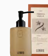
Sabonete Líquido Tabaco & Vanilla - 220ml Ref.: 10405220