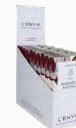
Barra de Cera Perfumada Magnólia Pacífica - cx. com 10 x 40g Ref.: 14109640