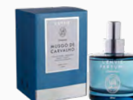
Home Spray Musgo de Carvalho - 200ml Ref.: 104188200