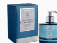
Sabonete Líquido Musgo de Carvalho - 200ml Ref.: 104288200