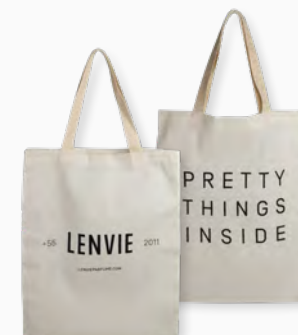
Ecobag Ref.: 446057