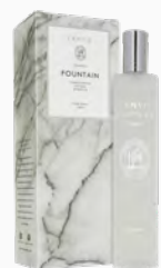
Home Spray Fountain - 100ml Ref.: 104001100