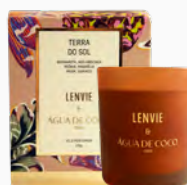
Vela Perfumada Terra do Sol - 210g Ref.: 104359210