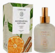
Home Spray Mandarina Ceylon - 200ml Ref.: 104074200