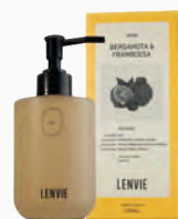
Sabonete Líquido Bergamota & Framboesa - 220ml Ref.: 103072220