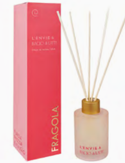
Difusor de Perfume Fragola - 130ml Ref.: 105081130