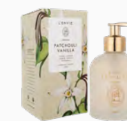
Sabonete Líquido Patchouli Vanilla - 200ml Ref.: 102033200