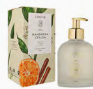
Sabonete Líquido Mandarina Ceylon - 200ml Ref.: 102074200