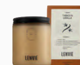
Vela Perfumada Tabaco & Vanilla - 190g Ref.: 102018190