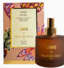
Home Spray Terra do Sol - 200ml Ref.: 104050200