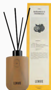
Difusor de Perfume Bergamota & Framboesa - 220ml Ref.: 105072220