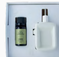
Kit Aromatizador Eléctrico + Óleo Concentrado Flor de Laranjeira - 20ml Ref.: 14097920