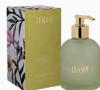
Sabonete Líquido Summer Pear - 200ml Ref.: 102015200