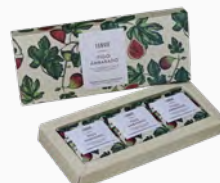
Kit Sabonete em Barra Figo Ambarado - 3 x 80g Ref.: 102079380