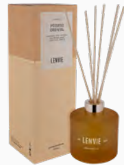
Difusor de Perfume Pêssego Oriental - 200ml Ref.: 105083200