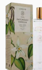
Home Spray Patchouli Vanilla - 100ml Ref.: 104033100