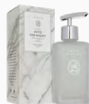
Sabonete Líquido Into the Night - 250ml Ref.: 102003250