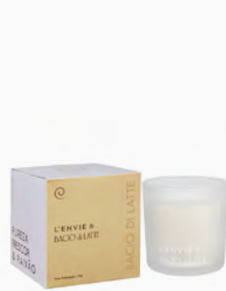
Vela Perfumada Bacio di Latte - 170g Ref.: 104084170

Saída: Accord Creamy, Notas Frescas, Pêssego Corpo: Accord Gelato, Cyclamen, Violeta, Frésia Fundo: Sândalo, Baunilha