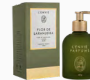
Sabonete Líquido Flor de Laranjeira - 200ml Ref.: 102079200