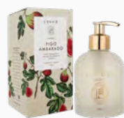
Sabonete Líquido Figo Ambarado - 200ml Ref.: 102009200