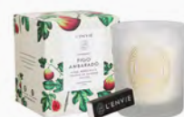
Vela Perfumada Figo Ambarado - 210g Ref.: 106392210