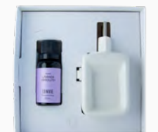
Kit Aromatizador Eléctrico + Óleo Concentrado Lavanda Absoluta - 20ml Ref.: 14012020