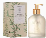
Sabonete Líquido Alecrim Mediterrâneo - 200ml Ref.: 106284200