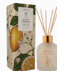
Difusor de Perfume Citrus Verbena - 200ml Ref.: 105011250

Fundo: Musk, Cedro, Sândalo, Notas Powdery