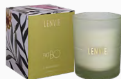
Vela Perfumada Summer Pear - 210g Ref.: 104051210