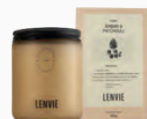
Vela Perfumada Âmbar & Patchouli - 190g Ref.: 102024190