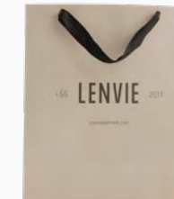
Sacola Tamanho G Ref.: 446055