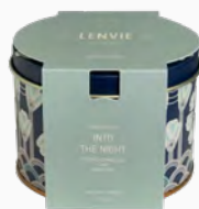
Vela Perfumada em Lata Into the Night - 250g Ref.: 1040332250