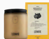
Vela Perfumada Bergamota & Framboesa - 190g Ref.: 102072190