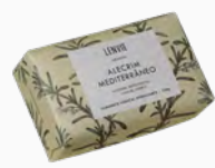
Sabonete em Barra Alecrim Mediterrâneo - 150g Ref.: 102026150