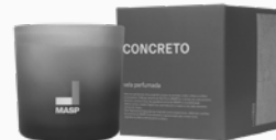
Vela Perfumada Concreto MASP - 170g Ref.: 10631170

Saída: Pimenta Preta, Bergamota, Folha de Violeta Corpo: Cedro da Virgínia, Madeira de Caxemira, Madeiras Resinosas Fundo: Patchouli, Vetiver, Sândalo, Couro