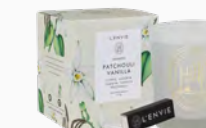
Vela Perfumada Patchouli Vanilla - 210g Ref.: 104033190