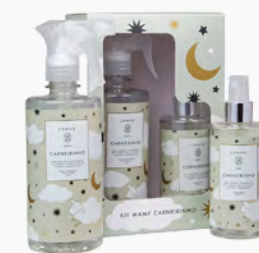
Kit Mamy Carneirinho Água Perfumada e Home Spray Ref.: 10704027