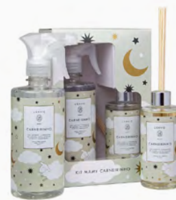
Kit Mamy Carneirinho Água Perfumada e Difusor Ref.: 10705027