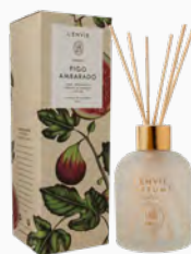
Difusor de Perfume Figo Ambarado - 200ml Ref.: 105009250