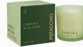
Vela Perfumada Pistacchio - 170g Ref.: 104082170

Saída: Maçã Verde, Sorbet de Pêra Corpo: Accord Gelato, Pistache, Mix de Nozes Fundo: Fava Tonka, Baunilha