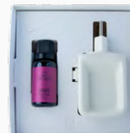
Kit Aromatizador Eléctrico + Óleo Concentrado Into the Night - 20ml Ref.: 14090020