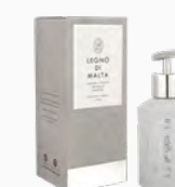
Sabonete Líquido Legno di Malta - 200ml Ref.: 102017200