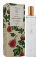
Home Spray Figo Ambarado - 100ml Ref.: 104092100