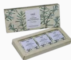
Kit Sabonete em Barra Alecrim Mediterrâneo - 3 x 80g Ref.: 102022380