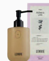
Sabonete Líquido Peônia & Lima - 220ml Ref.: 103043220