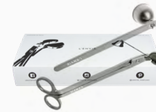
Conjunto Aparador e Abafador de Vela - Prata Ref.: 101002022