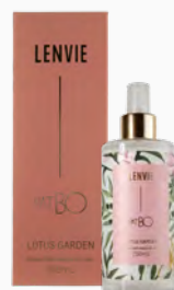
Água Perfumada Splash Lotus Garden - 250ml Ref.: 106012250