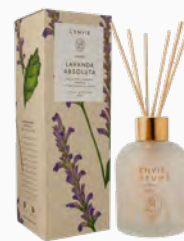
Difusor de Perfume Lavanda Absoluta - 200ml Ref.: 105012250

Fundo: Madeiras Secas, Sândalo, Vetiver, Âmbar, Notas de Couro