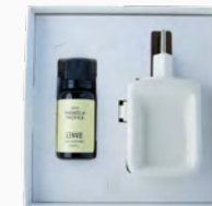
Kit Aromatizador Eléctrico + Óleo Concentrado Magnólia Pacífica - 20ml Ref.: 14093020