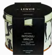
Vela Perfumada em Lata Patchouli Vanilla - 250g Ref.: 104033250