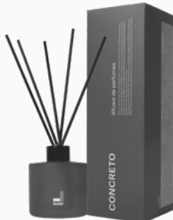
Difusor de Perfume Concreto MASP - 200ml Ref.: 10231200