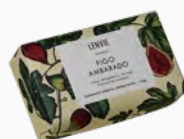
Sabonete em Barra Figo Ambarado - 150g Ref.: 102079150