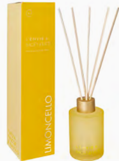
Difusor de Perfume Limoncello - 130ml Ref.: 105039130