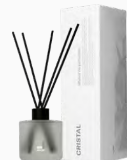
Difusor de Perfume Cristal MASP - 200ml Ref.: 10230200