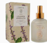
Home Spray Lavanda Absoluta - 200ml Ref.: 104012230