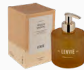
Sabonete Líquido Pêssego Oriental - 200ml Ref.: 102083200