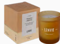
Vela Perfumada Pêssego Oriental - 210g Ref.: 104083210