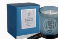
Vela Copo Musgo de Carvalho - 210g Ref.: 104388190