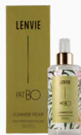
Água Perfumada Splash Summer Pear - 250ml Ref.: 106071250