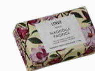
Sabonete em Barra Magnólia Pacífica - 150g Ref.: 102042150