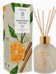
Difusor de Perfume Mandarina Ceylon - 200ml Ref.: 105074200