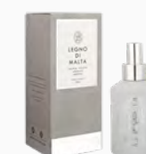
Home Spray Legno di Malta - 200ml Ref.: 104017200