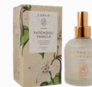
Home Spray Patchouli Vanilla - 200ml Ref.: 104033230