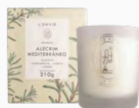
Vela Perfumada Alecrim Mediterrâneo - 210g Ref.: 106384210