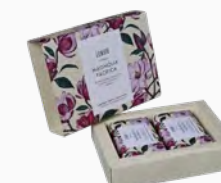
Kit Sabonete em Barra Magnólia Pacífica - 2 x 150g Ref.: 102062150