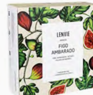
Kit Aromatizador Eléctrico + Barra de Cera Perfumada Figo Ambarado - 40g Ref.: 10139274