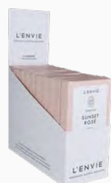
Barra de Cera Perfumada Sunset Rosé - cx. com 10 x 40g Ref.: 14101340