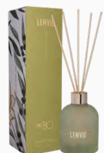
Difusor de Perfume Summer Pear - 200ml Ref.: 105015200