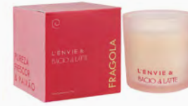
Vela Perfumada Fragola - 170g Ref.: 104081170

Saída: Folhas de Morango, Abacaxi, Nectarina, Bergamota, Pêra Corpo: Accord Gelato Frutas Vermelhas, Néctar de Morango Fundo: Baunilha, Chantilly