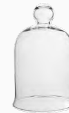
Redoma de Vidro 24cm x 13,5cm x 13,5cm Ref.: 38101