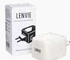
Aromatizador Cerâmico Elétrico Ref.: 14009667