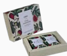
Kit Sabonete em Barra Figo Ambarado - 2 x 150g Ref.: 102092150