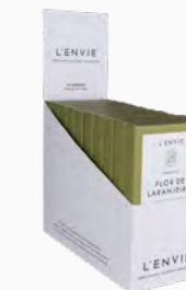
Barra de Cera Perfumada Flor de Laranjeira - cx. com 10 x 40g Ref.: 14107940