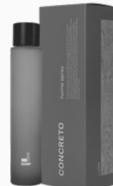
Home Spray Concreto MASP - 100ml Ref.: 10331100