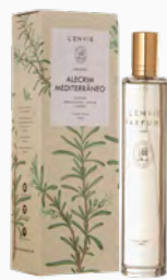
Home Spray Alecrim Mediterrâneo - 100ml Ref.: 106184100