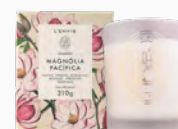
Vela Perfumada Magnólia Pacífica - 210g Ref.: 107013210