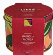
Vela Perfumada em Lata Magnólia Pacífica - 250g Ref.: 107013250