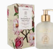
Sabonete Líquido Magnólia Pacífica - 200ml Ref.: 102013200