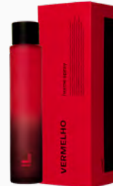
Home Spray Vermelho MASP - 100ml Ref.: 10350100