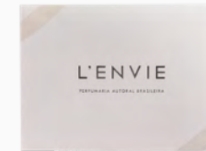
Caixa Presente com Laço Ref.: 408105