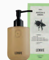
Sabonete Líquido Matcha & Hinoki - 220ml Ref.: 103016220