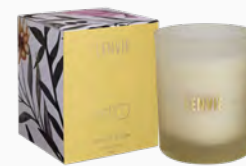
Vela Perfumada Vanilla Bloom - 210g Ref.: 104044210