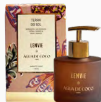
Sabonete Líquido Terra do Sol - 200ml Ref.: 104259200