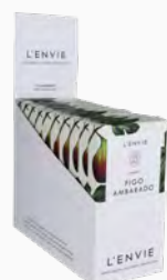
Barra de Cera Perfumada Figo Ambarado - cx. com 10 x 40g Ref.: 14102940