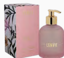
Sabonete Líquido Lotus Garden - 200ml Ref.: 102040200