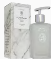
Sabonete Líquido Fountain - 250ml Ref.: 102001250