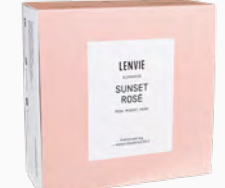
Kit Aromatizador Eléctrico + Barra de Cera Perfumada Sunset Rosé - 40g Ref.: 10131874