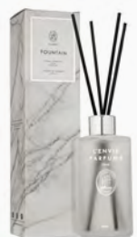
Difusor de Perfume Fountain - 250ml Ref.: 105001201