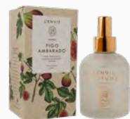
Home Spray Figo Ambarado - 200ml Ref.: 104009230