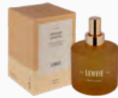
Home Spray Pêssego Oriental - 200ml Ref.: 104083200