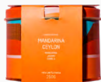
Vela Perfumada em Lata Mandarina Ceylon - 250g Ref.: 104074250