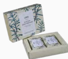
Kit Sabonete em Barra Alecrim Mediterrâneo - 2 x 150g Ref.: 102022150