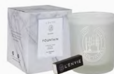
Vela Perfumada Fountain - 210g Ref.: 101001200