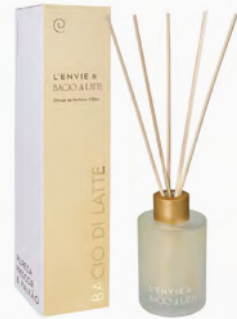
Difusor de Perfume Bacio di Latte - 130ml Ref.: 105084130