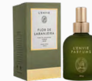
Home Spray Flor de Laranjeira - 200ml Ref.: 104079200