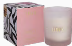
Vela Perfumada Lotus Garden - 210g Ref.: 104040210

Fundo: Cedro, Âmbar, Musk, Musgo de Carvalho