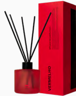
Difusor de Perfume Vermelho MASP - 200ml Ref.: 10250200