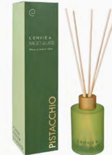
Difusor de Perfume Pistacchio - 130ml Ref.: 105082130