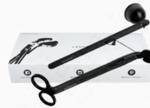
Conjunto Aparador e Abafador de Vela - Preto Ref.: 101002021