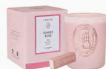
Vela Perfumada Sunset Rosé - 210g Ref.: 105018190