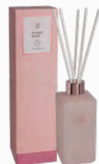
Difusor de Perfume Sunset Rosé - 250ml Ref.: 105018250