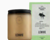
Vela Perfumada Matcha & Hinoki - 190g Ref.: 102016190