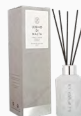
Difusor de Perfume Legno di Malta - 200ml Ref.: 105017200