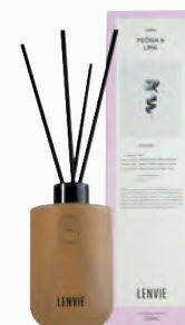
Difusor de Perfume Peônia & Lima - 220ml Ref.: 105043220