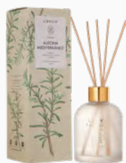
Difusor de Perfume Alecrim Mediterrâneo - 200ml Ref.: 106084200