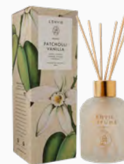
Difusor de Perfume Patchouli Vanilla - 200ml Ref.: 105033250